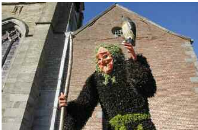
Magnifique sorcière réalisée par les services provinciaux.

Avec la collaboration des services communaux, ils les ont mises en place sur le perron de l'église St Pierre aux Liens où elles sont restées durant le mois de juillet, pour la plus grande joie des petits et des grands, habitants ou touristes