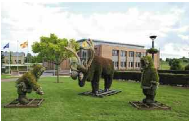
Mosaïcultures ayant rejoint Ellezelles après le Québec.

Autour de la maison communale, ce sont d'autres réalisations, qui avaient déjà représenté notre province au Québec, qui ont été mises en scène.