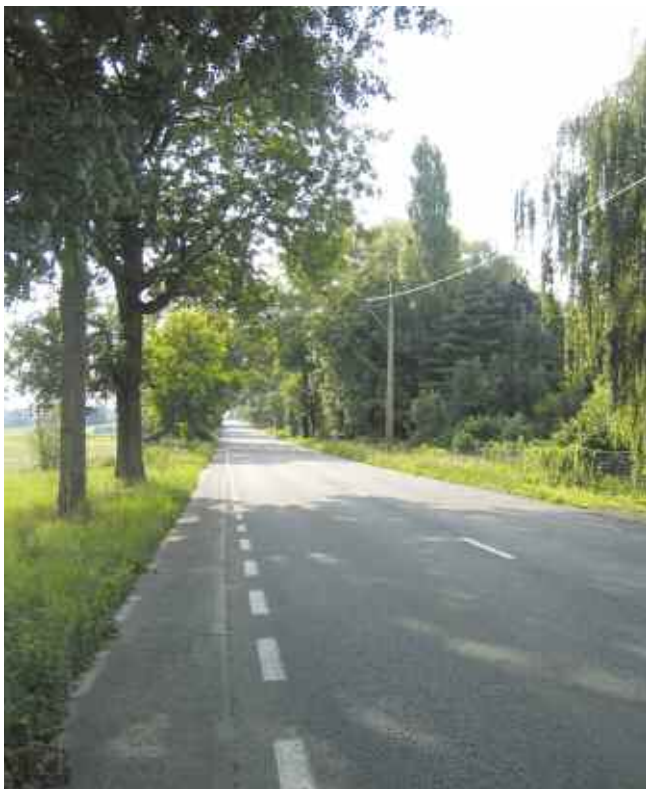
Route régionale Ellezelles-Renaix

La route Lessines-Frasnes, qui passe par Lahamaide, est une voirie provinciale .