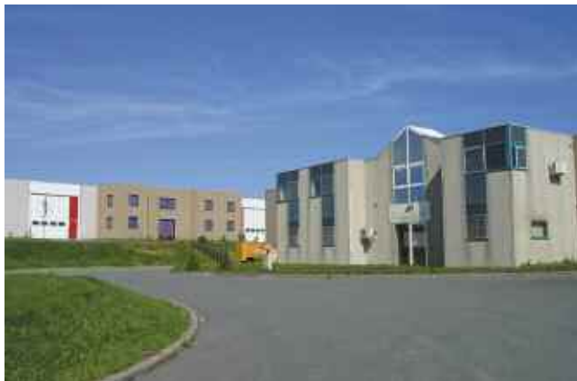
Vue partielles des ateliers ruraux des Quatre Vents.

(près de 90 %) qui avaient été alloués par l'Union Européenne pour la construction d'ateliers ruraux aux Quatre Vents avaient bien été utilisés.