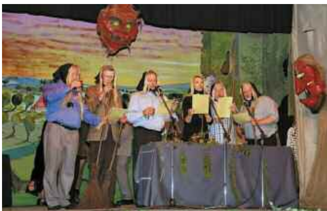
Quelques intronisés, parmi lesquels on reconnaît la Ministre Fonck.