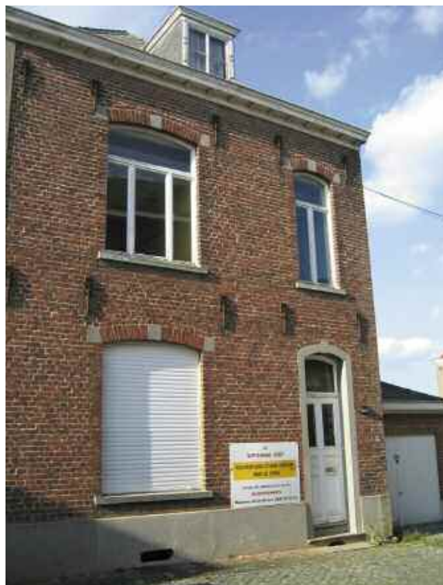
La crèche avant les travaux

C'est ainsi que notre commune se voit dotée d'un instrument supplémentaire dans sa politique d'accueil de l'enfance.